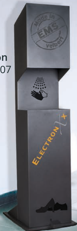
Rainbow Edition Art.-Nr.: 500001